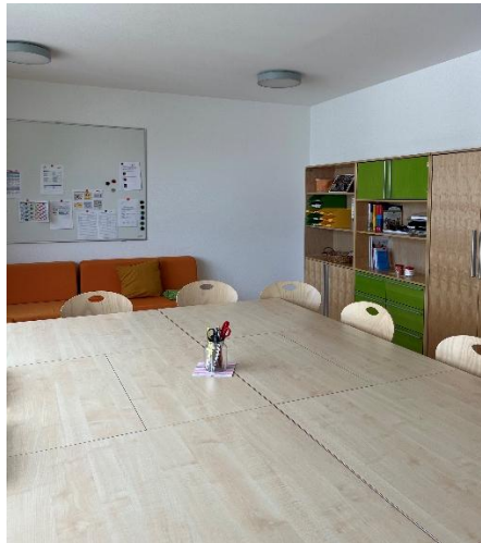
Personalraum für Teambesprechungen und als Rückzugsort

Des Weiteren finden vier Planungs- und Teamtage pro Kitajahr statt, um unsere Qualität stetig anzuheben und Abläufe weiterhin auf die Bedürfnisse der Kinder abzustimmen.