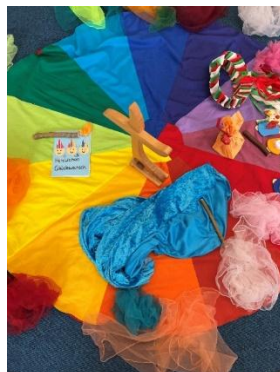
Geburtstagsteppich im Morgenkreis

Das Geburtstagskind hat die Möglichkeit im Sinne der Partizipation, seine Geburtstagsfeier aktiv mitzugestalten. Hierfür haben wir unseren Geburtstagskoffer. In diesem befinden sich verschiedene Anreize, wie z.B. Geburtstagslieder, Fingerspiele, diverse Dekorationsmöglichkeiten für die Mitte des Kreises, Dekoration für den Geburtstagsstuhl, eine Krone, die sich das Kind nach eigenen Wünschen aussuchen darf, um die Feier selbstgewählt zu gestalten.