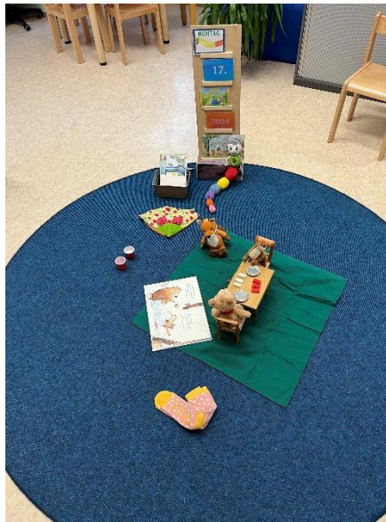
Gestaltung des Morgenkreises mit Elementen „Datum“, „Jahreszeit“, „Kalenderjahr“