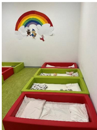
Einer unserer Krippenschlafräume

Spielen, Toben und Lernen macht müde. Schlafen und Ausruhen bedeutet Entspannung für Körper und Geist und ist in unserem Tagesablauf fest verankert. Gerade bei den Kleinsten sind die Schlafgewohnheiten sehr verschieden. Im Rahmen unserer Möglichkeiten werden diese Schlafgewohnheiten berücksichtigt und die Kinder beim Einschlafen durch gedimmtes Licht, eine vorgelesene Geschichte, ein Einschlaflied, oder ruhige Musik aus der Toniebox begleitet. Jedes Kind hat sein eigenes Bettchen, welches individuell mit einem Kuscheltier und/oder Schnuller etc. ausgestattet ist. Das gibt den Kindern Sicherheit und Wohlbefinden. Spannbettlaken, Decke und Kissen wird von der Kita gestellt und selbst gewaschen, um ein geschlossenes Hygienesystem zu bieten. Schläft Ihr Kind z.B. mit einem Schlafsack, darf dieser mitgebracht werden.