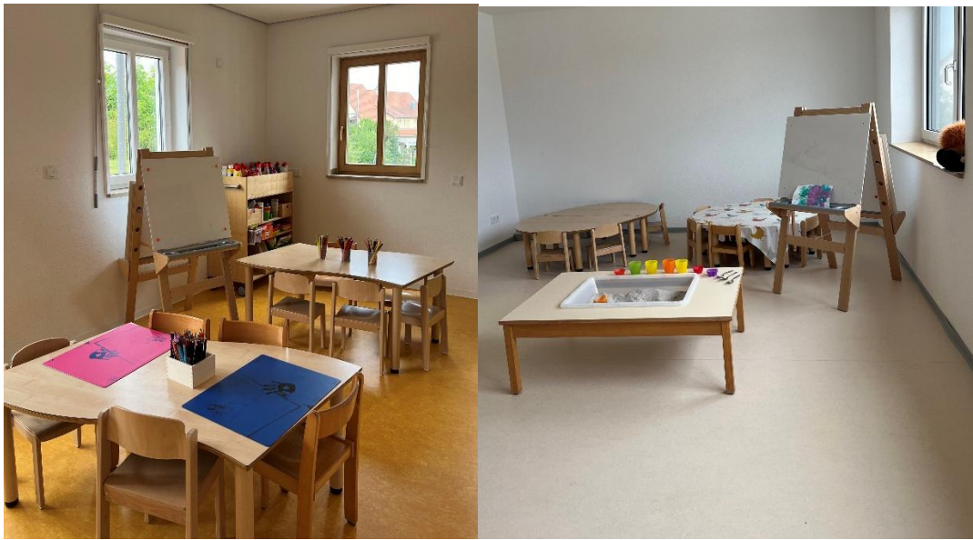
Links das Atelier des Kindergartens, rechts ein Nebenraum Krippe