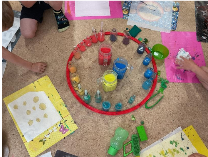
Die Vorschulpiraten experimentieren im Vorschulzimmer mit Farben

Februar stattfinden (z.B. gemeinsame Faschingsfeier, Schulhausrallye, eine Probeunterrichtsstunde, gemeinsame Turnstunde) und ein Vorschulflug (das Ausflugsziel wird im Sinne der Partizipation mit den Kindern gemeinsam ausgesucht). Hausübergreifend finden regelmäßig Treffen mit den „Bergzwerge“ (die andere ortsansässige BRK Kita) statt. So können sich die zukünftigen Erstklässler untereinander besser kennenlernen.